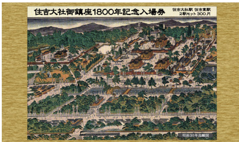
表紙（明治30年鳥瞰図）

入場券を収めている台紙の表紙デザインには、同大社所蔵の鳥瞰図（表紙・明治30年当時、裏表紙・平成22年当時）を使用。大社境内の昔も今も変わらぬ風雅なたたずまいを中心に、周辺の街並みや南海の鉄道（蒸気機関車から電車へ）の変遷を見比べていただけます。