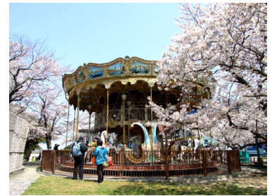
メリーゴーランド

高台に立つ観光灯台は、関西国際空港や明石海峡大橋が一望できるパノラマビュースポットです。園全体が桜でピンク色に染まっている様子をご覧ください。