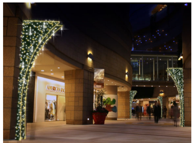
光のゲート（装飾イメージ）