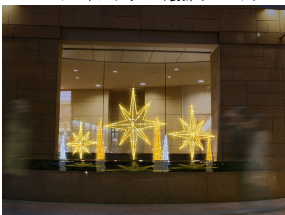
滝の泉（装飾イメージ）