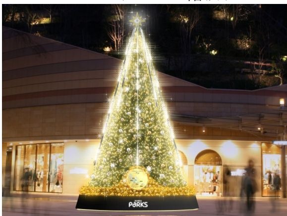
7mのメインツリー（装飾イメージ）