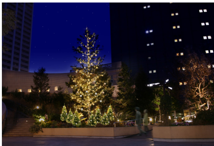
ドイツウヒのツリー（装飾イメージ）