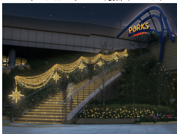
パークスガーデンへの階段（装飾イメージ）