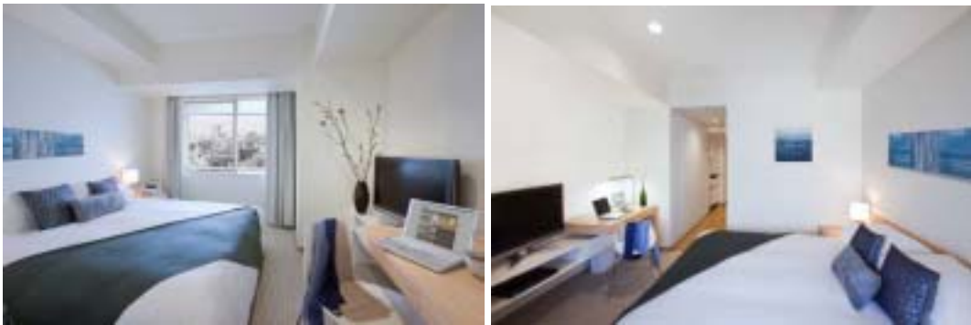
客室(スタジオタイプ)