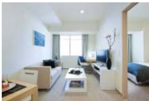
客室(1ベッドルームタイプ)

また、1階ではスペインバル「Massa(マッサ)」を9月に先行オープンします。スペイン料理をカジュアルに提供し、開業後は宿泊のお客さまに朝食サービスを行います。