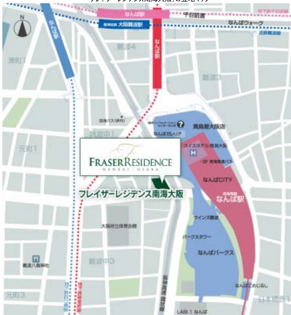
「フレイザーレジデンス南海大阪」の立地マップ

Email: sales.osaka@frasershospitality.com