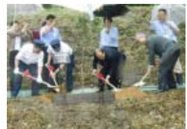
苗木の記念植樹 (平成19年6月22日撮影)

平成19年6月には、学文路～九度山駅間における桜並木の景観の魅力アップのため、従来の成木41本に加え、33本の苗木(ソメイヨシノ)を植樹。同プロジェクトスタート(同年10月)のきっかけとなりました。現在は景観保全のため、年間を通じて下草の伐採など手入れを行っています。