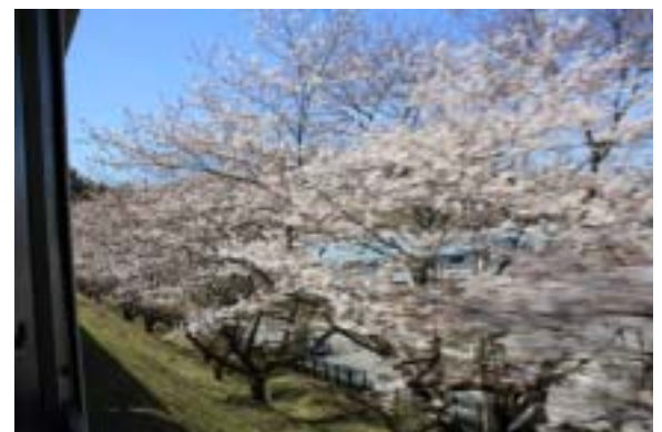
満開の桜が車窓に大接近！ (昨年3月30日撮影)