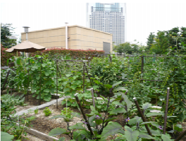
アーバンファームの区画