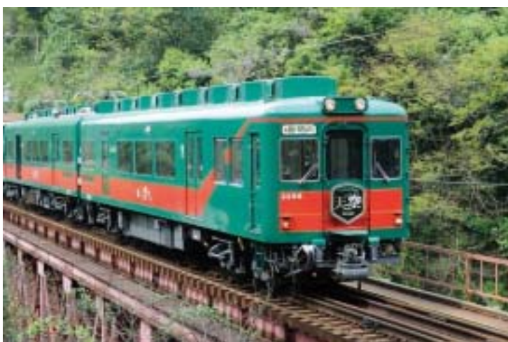
7月3日から定期運行を開始する「天空」