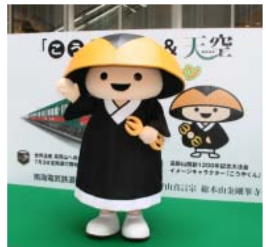
高野山開創1200年記念大法会 イメージキャラクター「こうやくん」