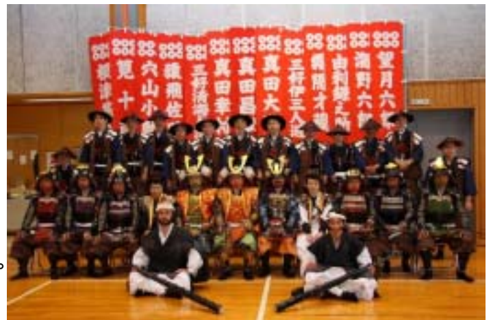
「真田十勇士」などに扮した九度山町の皆さん（真田祭で撮影）

高野山駅では、高野山開創1200年記念大法会イメージキャラクター「こうやくん」が、お客さまのお出迎え・お見送りを行ってムードを盛り上げます。