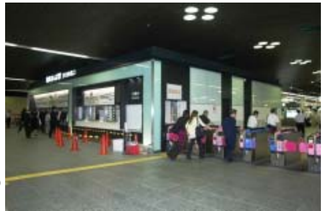
工事が進む 3 階北改札口 (6 月 25 日撮影)