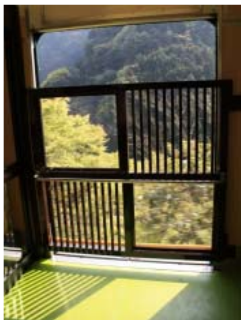
展望デッキスペース