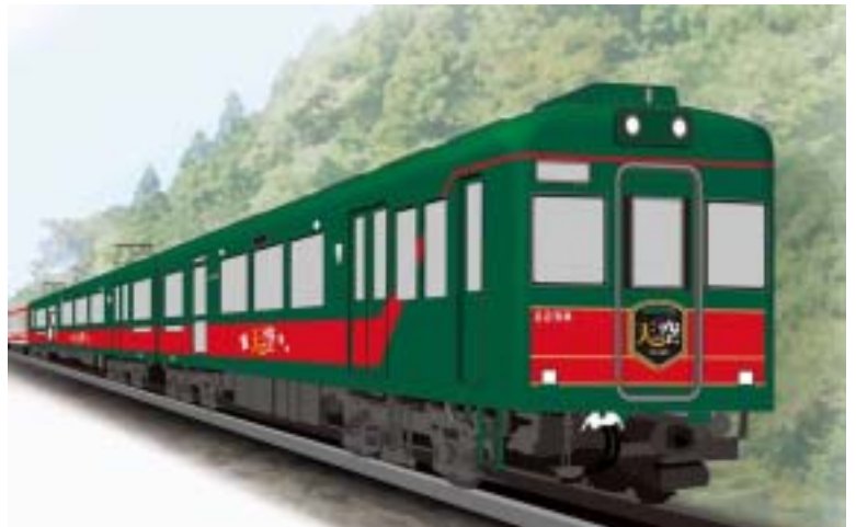
観光列車「天空」走行イメージ

今年の7月3日から橋本~極楽橋駅間で定期運行を開始する「観光列車」です。定期運行に先駆け、4月29日(水・祝)など全7日限定でプレ運行を実施します。