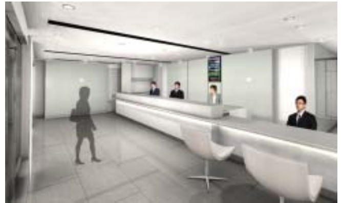
「難波駅サービスセンター」イメージ（改札外コンコースから見た外観と室内）