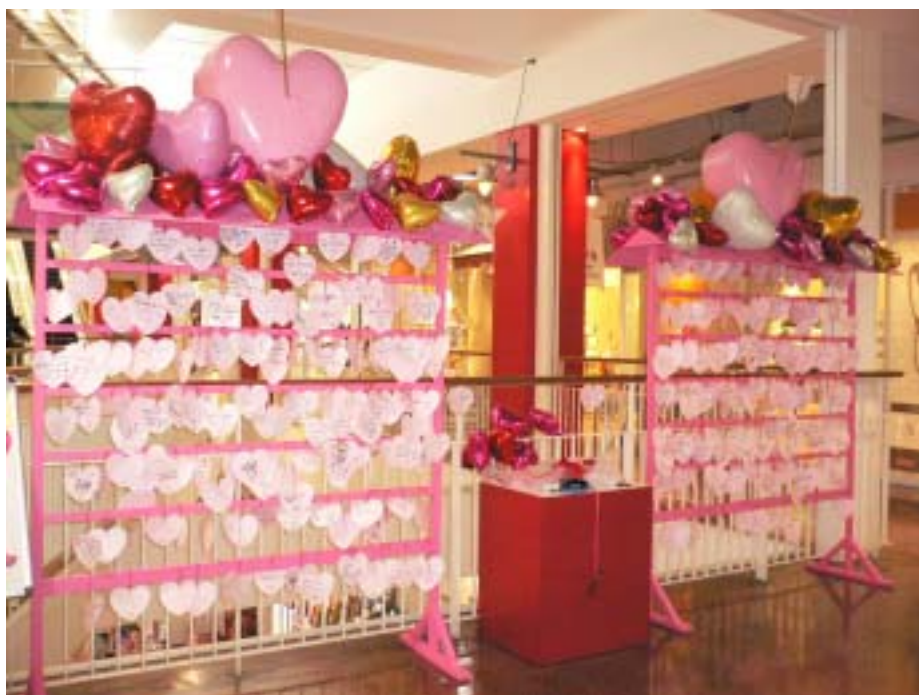
昨年の「恋愛成就絵馬」の様子