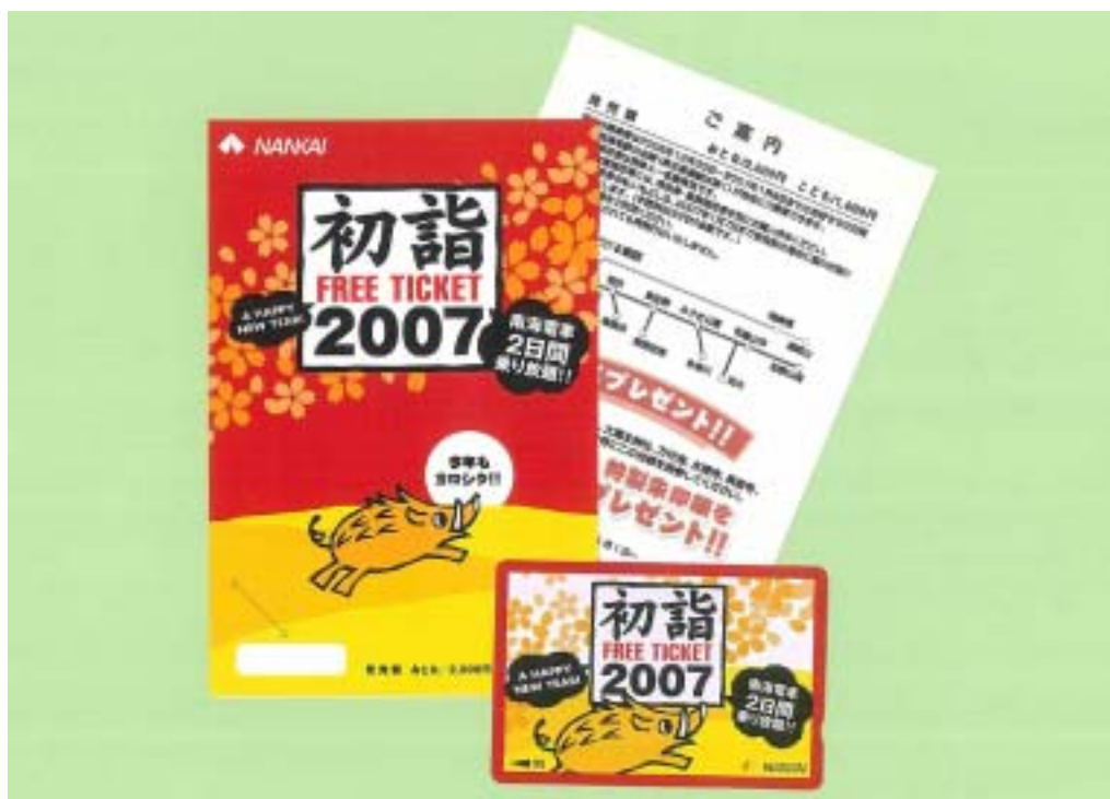
初詣 FREE TICKET 2007 (フリーチケット2007)

南海沿線七福神の 7 社寺で合計先着 500 名さまに「特製朱印帳」プレゼント！ フリー チケット 「初詣 FREE TICKET 2007」を発売します