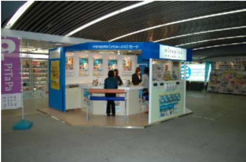
南海グループカード「minapita」の入会申し込みは、 難波駅2F中央口「minapitaカードなんばカウンター」で好評受付中！