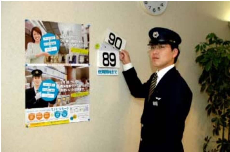
7月1日の「P i T a P a」導入へ向けてカウントダウンを開始！ (4月3日 難波駅長室にて)