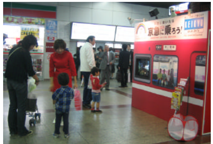
【昨年のキャンペーンの様子】