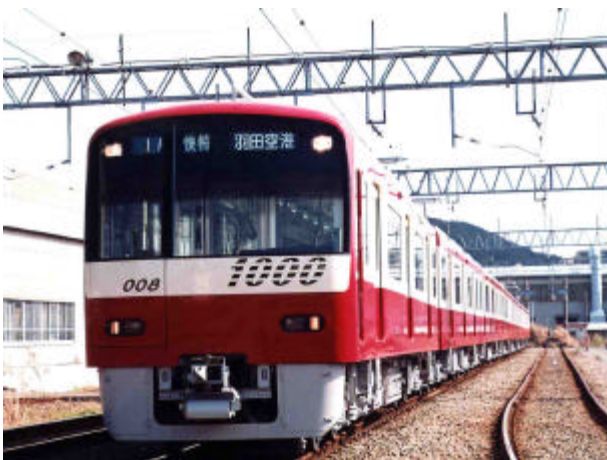
【京浜急行の赤い電車】