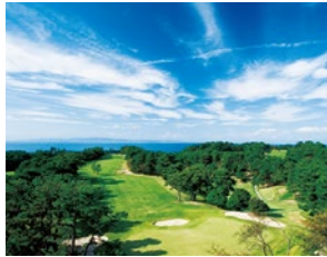
大阪ゴルフクラブ