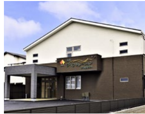
南海ライフリレーション岸和田吉井