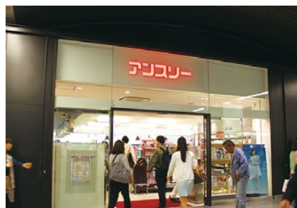
アンスリーなんばガレリア店