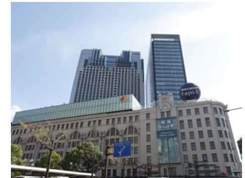
南海ビルとなんばスカイオ

また、沿線の主要ターミナルを中心に、商業・オフィスビル、マンション、鉄道高架下施設、駐車場などを経営しているほか、沿線外においても泉北高速鉄道が大規模物流施設「東大阪流通センター」「北大阪流通センター」を運営するなど、幅広い事業展開を進めています。