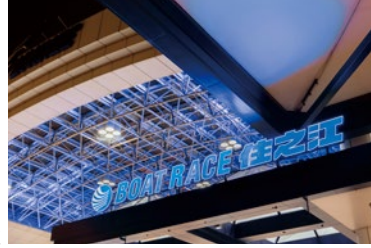
ボートレース住之江

住之江興業は、ボートレース施設の賃貸を行っています。ナイターレース開催や、SGボートレースオールスターをはじめ、数々の人気タイトルレースの開催に携わり、また、ボートピア梅田の円滑な運営に尽力するなど、ボートレース事業の活性化を図り、「Run to the Future!～限りなき挑戦～」のもと、様々な施策に取り組んでいます。