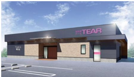
南海グリーンサポート「ティア堺伏尾」