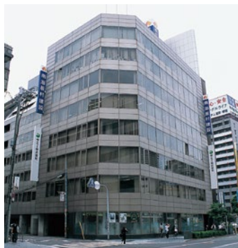
南海辰村建設本社ビル

南海辰村建設は、1923年の創業以来、当社の鉄道関連工事や大阪での日本万国博覧会・国際花と緑の博覧会、関西国際空港など、様々な建設工事を通じて、積み重ねた豊富な経験・ノウハウを生かし、土木・建築・電気など建設工事全般を手がける総合建設業を営んでいます。大阪を中心とした近畿圏および東京を中心とした首都圏に営業エリアを特化し、南海グループの建設事業を担うゼネコンとしてお客さまの信頼を獲得しています。