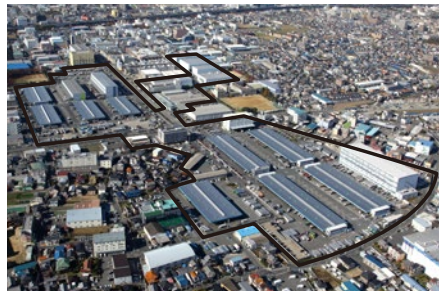
東大阪流通センター (総敷地面積 約227,000㎡)

「北大阪流通センター」では、2020年3月、建設を進めてきた新1号棟が竣工。複層階となった公共トラックターミナル(1,2階)は全国初であり、配送センター(3,4階)と一体となった利便性の高い物流施設です。