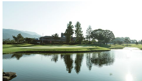
橋本カントリークラブ