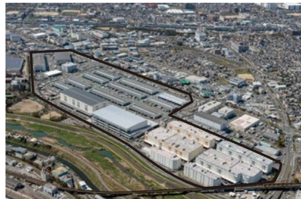
北大阪流通センター (総敷地面積 約272,000㎡)