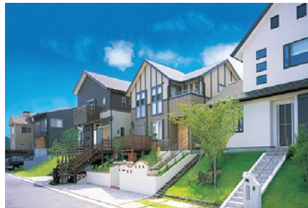
「南海くまとりつばさが丘」の街並み

関西国際空港を間近に臨み、大阪湾を一望できる非常に眺望の良い丘に位置しています。街びらき20周年を迎えた2020年には、特に眺望に優れ開放感あふれる新街区「ソラテラス」の分譲を開始しました。