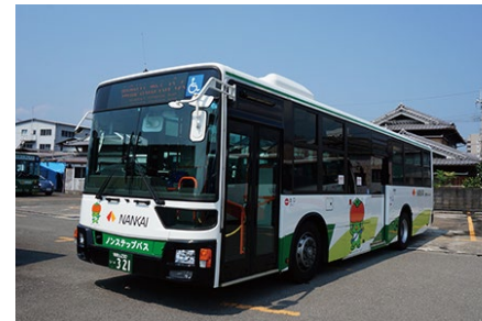
南海りんかんバス