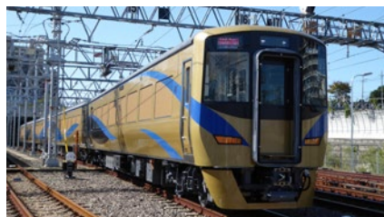
特急「泉北ライナー」