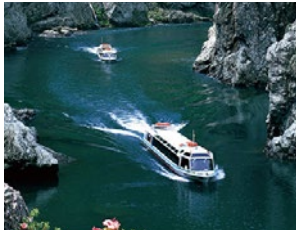
静峡ウォータージェット船

その他、静峡ウォータージェット船の運航やドライブイン事業を営む熊野観光開発、ゴルフ場「大阪ゴルフクラブ」「橋本カントリークラブ」を経営する南海ゴルフマネジメント、障がい者雇用を目的に清掃業務や郵便物仕分け業務を行う南海ハートフルサービス、「葬儀会館ティア」を運営する南海グリーンサポート、各種印刷物の受注・作成を行う南海印刷、広告代理業を営むアド南海、保険専門会社の南海保険サービス、有料老人ホーム事業や訪問介護事業などを営む南海ライフリレーションなどがあります。