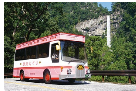
熊野めぐりレトロバス