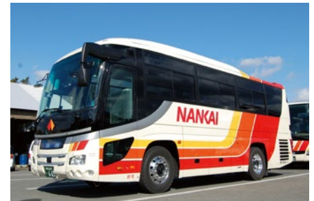
熊野御坊南海バス