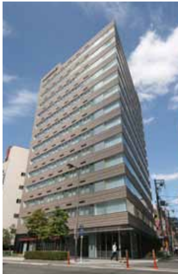
フレイザーレジデンス南海大阪