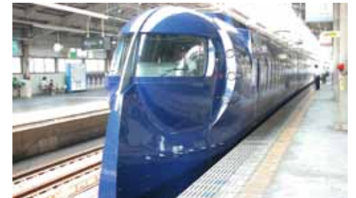
空港特急「ラピート」