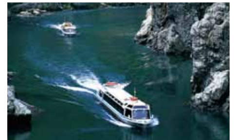
静峡ウォータージェット船