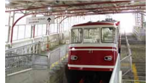
高野山ケーブルカー