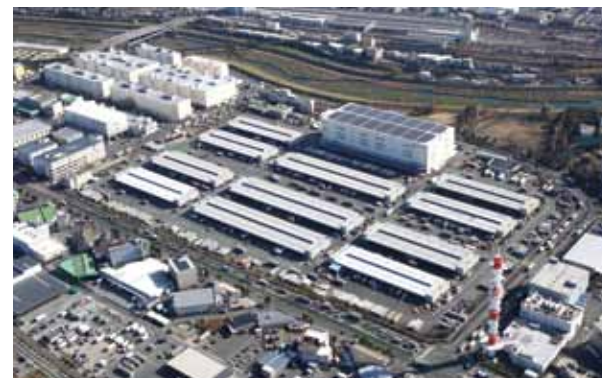
北大阪流通センター