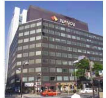
南海東京ビルディング