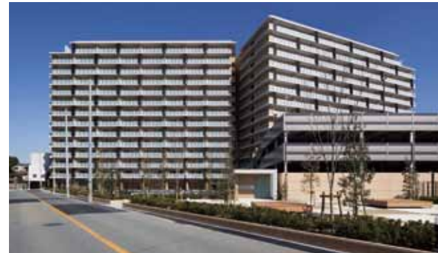
フランスヴェリテ堺七道