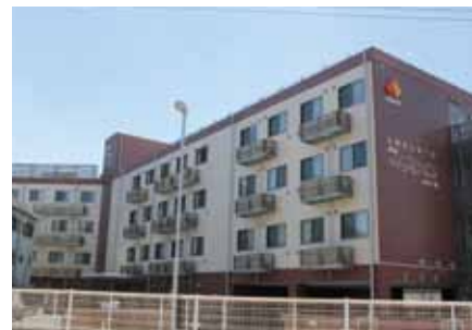
南海ライフリレーションあびこ道