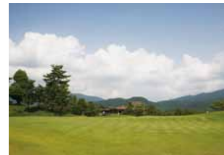
橋本カントリークラブ