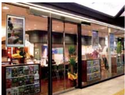
南海トラベルサロン