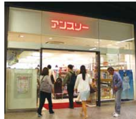
アンズリーなんばガレリア店