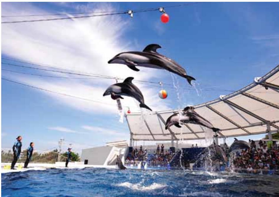
みさき公園「シャイニースタジアム」