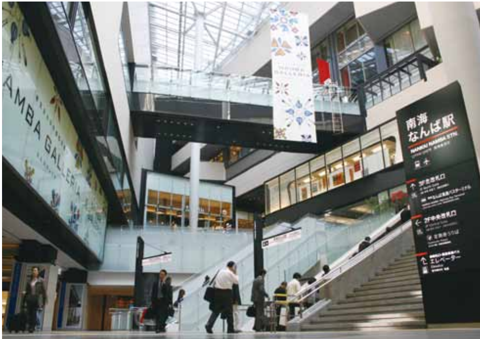
難波駅(なんばガレリア)