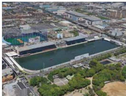
ポートルース住之江