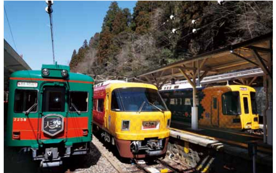
「天空」と特急「こうや」