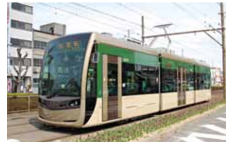
堺電気軌道「堺トラム」