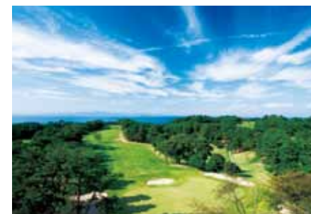
大阪ゴルフクラブ