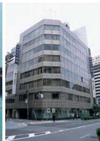
南海辰村建設本社ビル