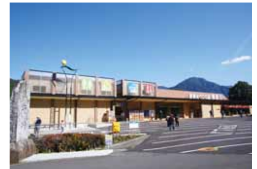
瀬峡めぐりの里「熊野川」