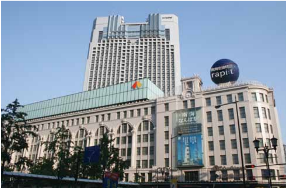
南海ビルとスイスホテル南海大阪