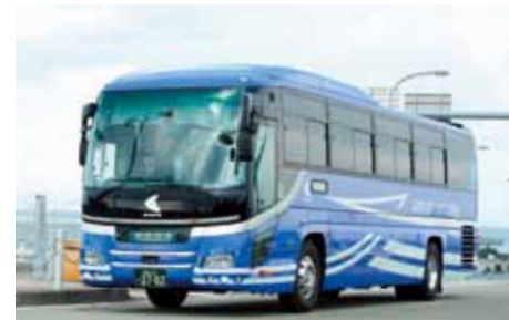
関空リムジンバス