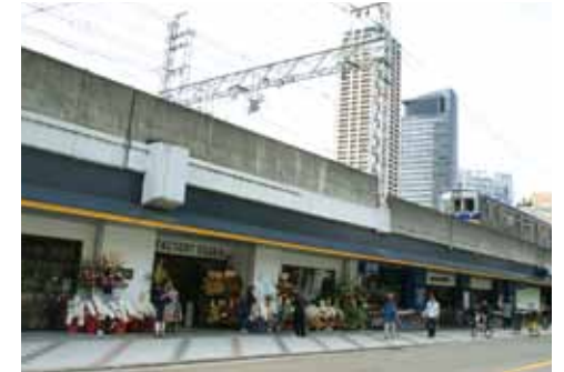
なんばEKIKANプロジェクト