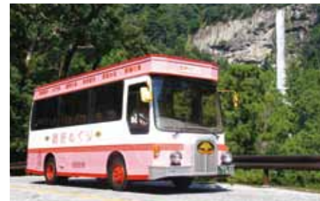
熊野めぐりレトロバス