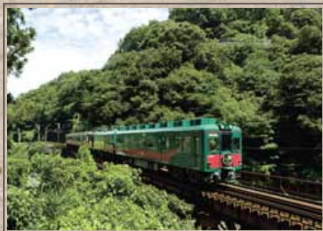
※Ligne de chemin de fer « Koya Hana Tetsudo »