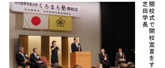
芝開校式で開校宣言をする