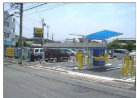
▲タイムズ尾崎駅前第2

住所:大阪府阪南市下出 65-1 台数:55台 料金:全日 30分 100円 駐車後 24時間 最大料金 400円 割引額:100円 対象駅:尾崎駅