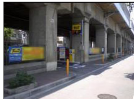
▲タイムズ南海住之江北

住所:大阪市住之江区浜口東 3-1 台数:39台 料金:全日 60分 200円 駐車後 24時間 最大料金 500円 割引額:100円 対象駅:住ノ江駅、住吉大社駅